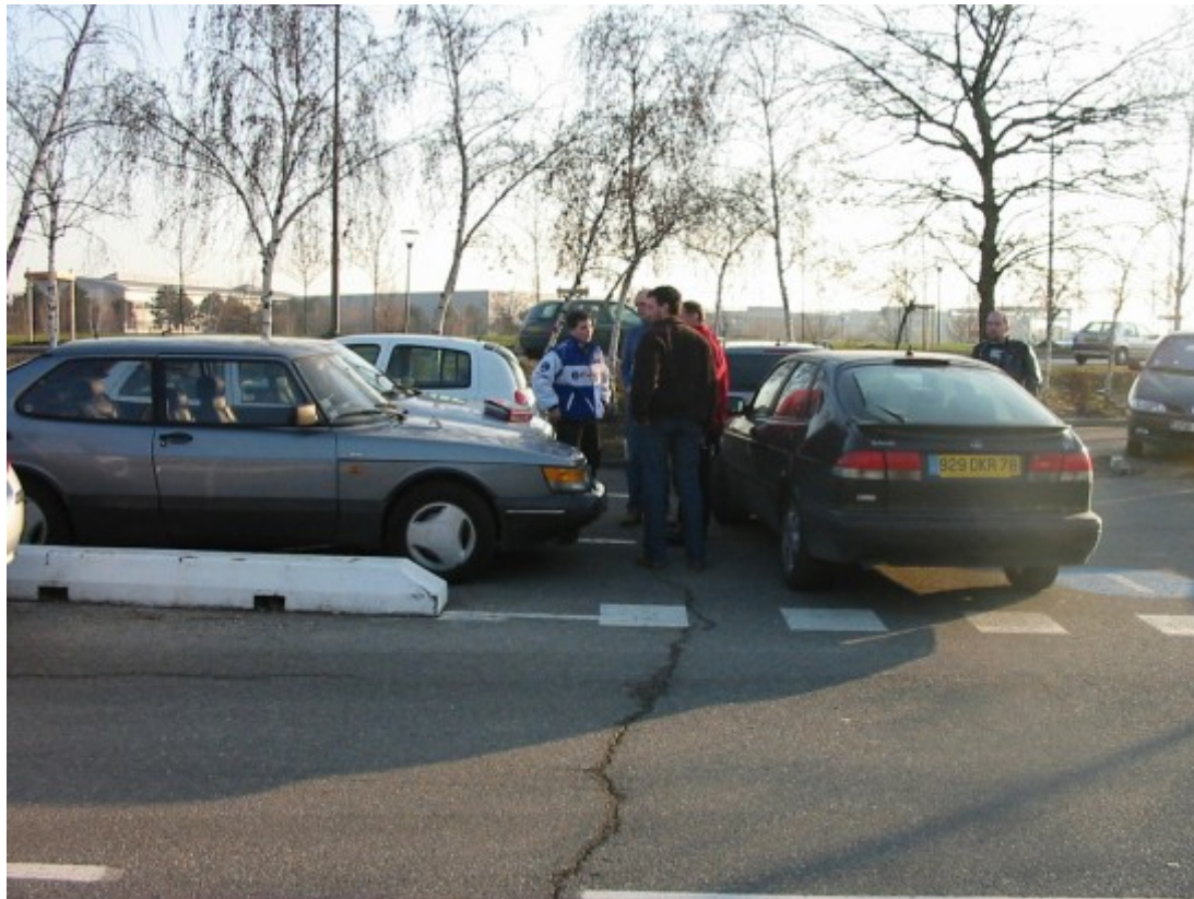
Sur le parking apres le repas

SAAB Club de France Http://www.saabclubdefrance.com