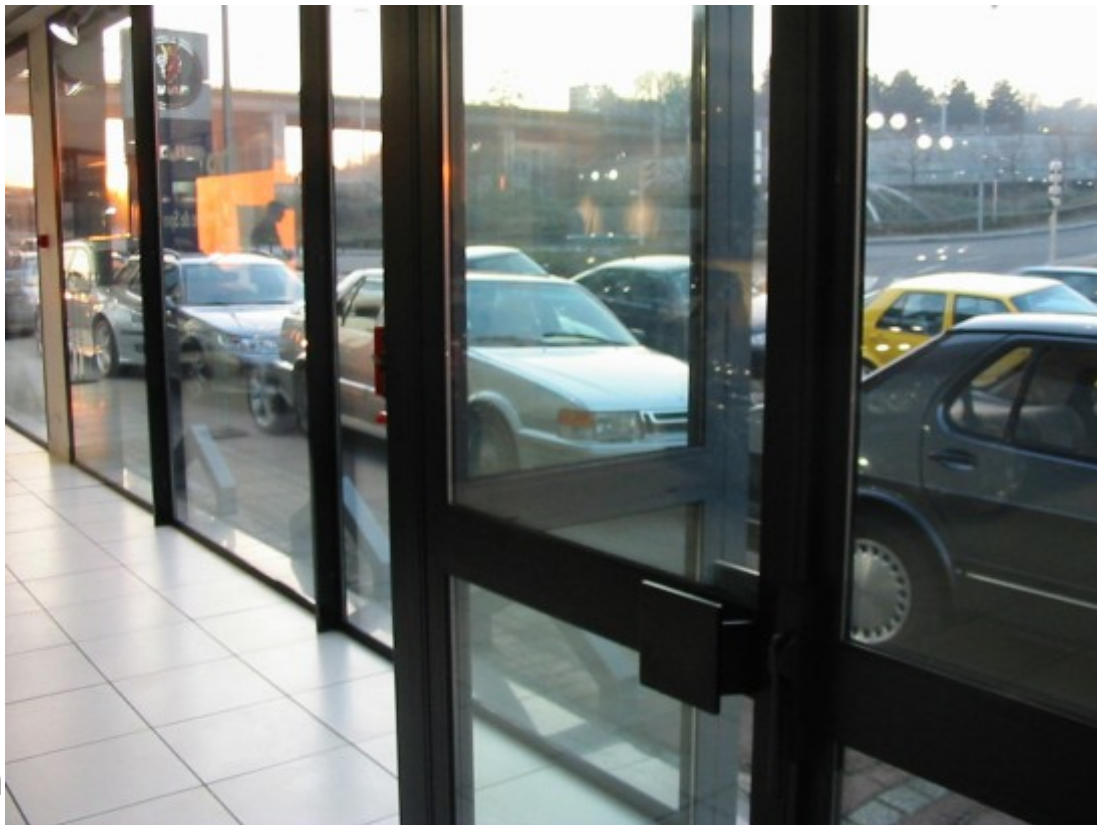
La concession SAAB LYON TASSIN

SAAB Club de France Http://www.saabclubdefrance.com